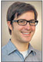
Von Stefan Rebein