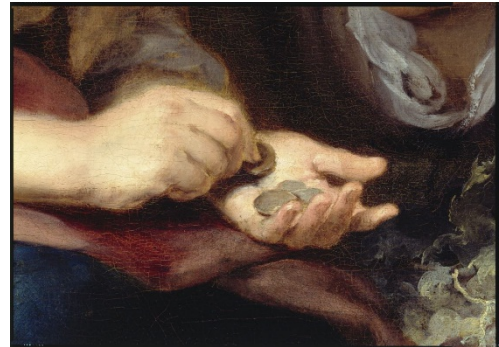
Murillo „Die kleine Obsthändlerin“ (Detail)

Der Tausch als kalkulierte Leistung und Gegenleistung gilt als typisch für den Wirtschaftsprozess. Mit Kauf- und Arbeitsverträgen kann man jedoch nur bedingt erklären, was die Wirtschaft tagtäglich am Laufen hält. Verkannt wird meist, wie stark das Funktionieren von Märkten und Betrieben von „Gaben“ abhängt. Das sind Beiträge, die nicht vertraglich erwartet werden können, die nicht um eines Nutzens willen gegeben werden und die dennoch – und deshalb – dem Gemeinwohl dienen und die Grundlagen der Wirtschaft stärken, zumal soweit sie weitere Gaben anderer auslösen.