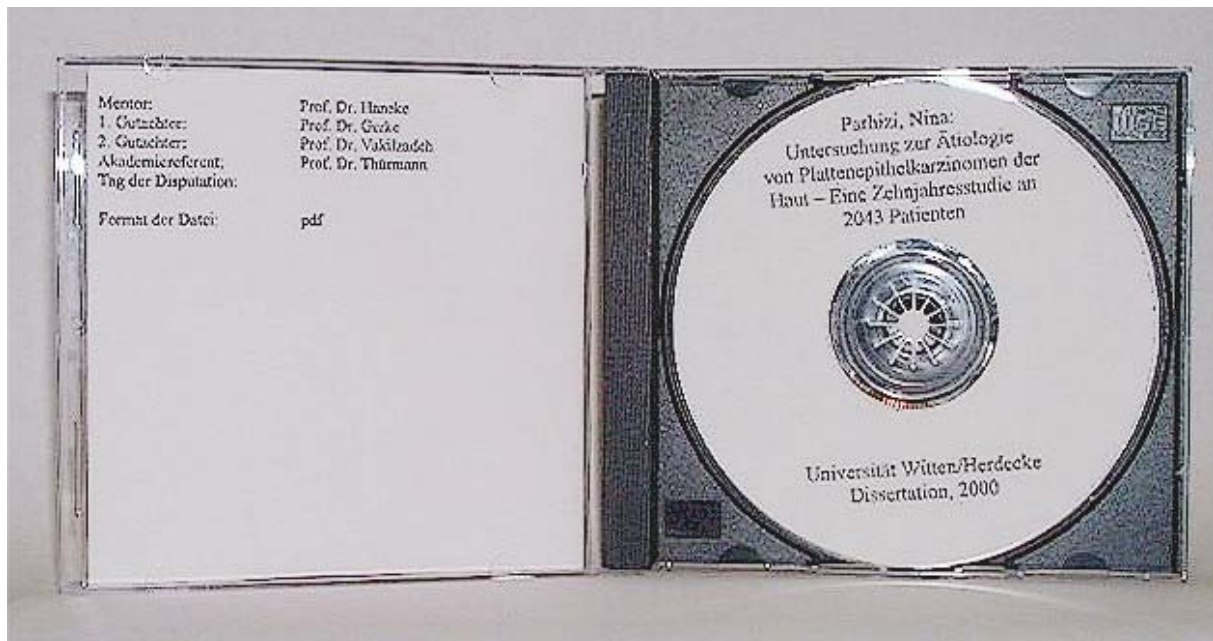
Abbildung 2: Rückseite des Booklets und CD-ROM-Etikett